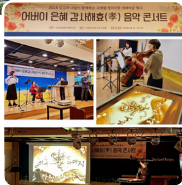
▶5월 어버이날 행사