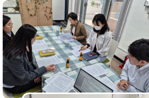
▶4월 응암2동 지역밀착형 민관협력 회의