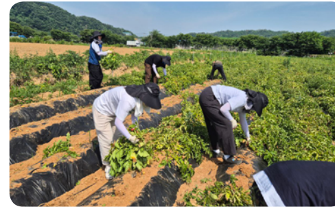
▶6월 대학생 사회봉사단 에블루션 농촌봉사활동