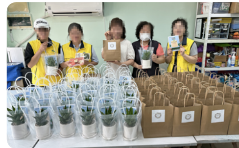
▶6월 마음커넥팅 '절기행사'