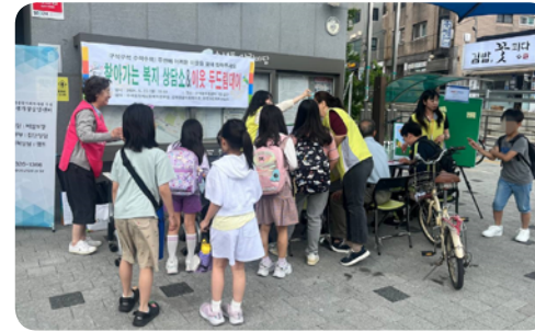
▶5월 찾아가는 주민데이(수색동)