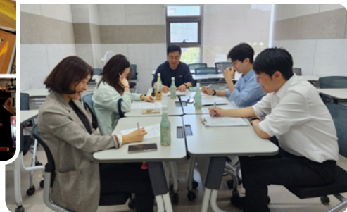
▶5월 은평형 동단위 민관협력 네트워크 3권역 회의