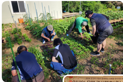
▶5월 무지개모임 주말농장체험