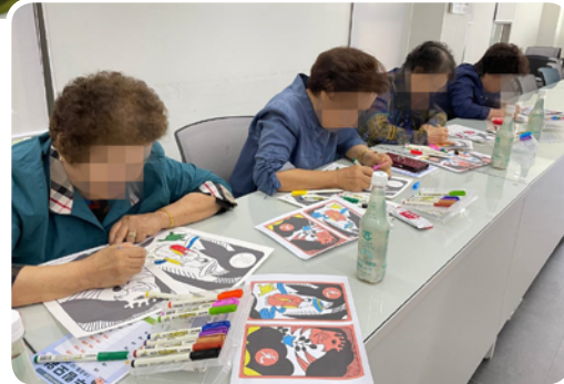
▶5월 수색동 누림모임(미술활동)