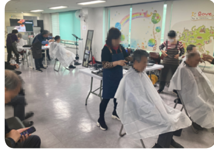
▶4월 무료 이미용 서비스