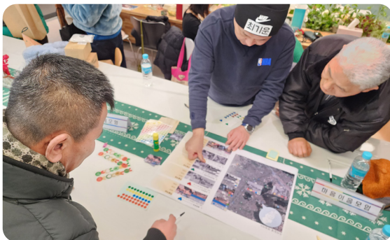
▶ 12월 행복함끼 프로그램 맛집지도 만들기 진행