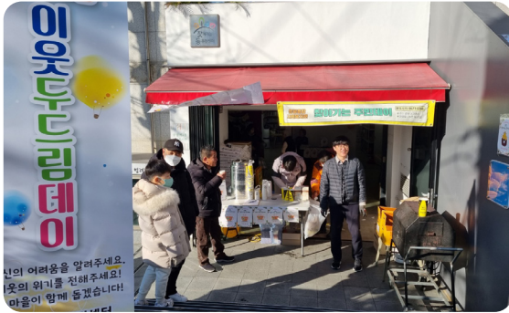
▶ 12월 응암2동 찾아가는 주민데이 진행