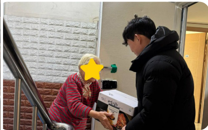
▶ 12월 수색·증산동팀 김장지원행사