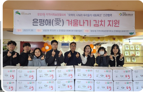
▶ 11월 응암2동 겨울김치지원 사업 진행