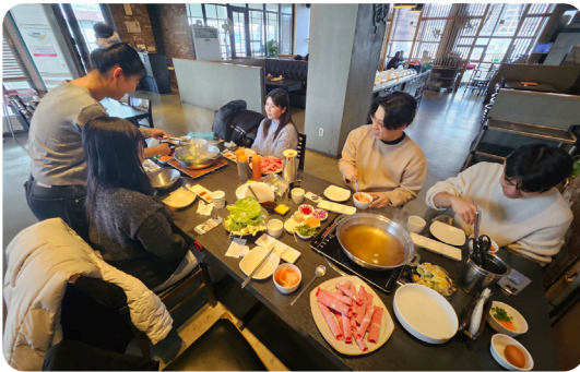
▶ 12월 대학생사회봉사단 에블루션 평가회 만들기 활동