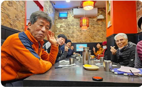
▶ 12월 응암2동 푸른모임 활동 공유회