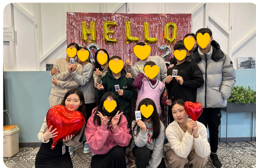
▶ 12월 아동가족 파일럿 프로그램