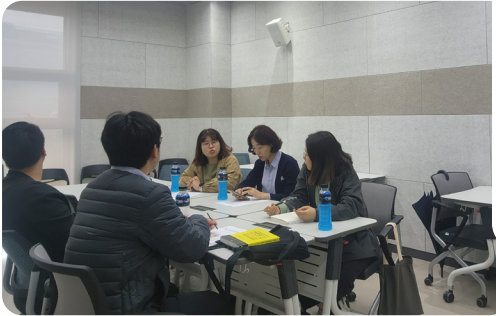
▶ 10월 은평형 동단위 네트워크 3권역 회의 개최