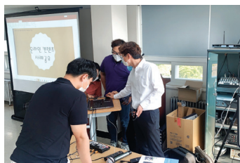
▶ 전직원 온라인 콘텐츠 워크숍2