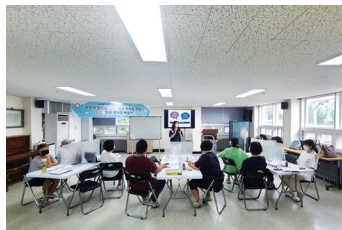
▶ 일상&인권 반나절배움터