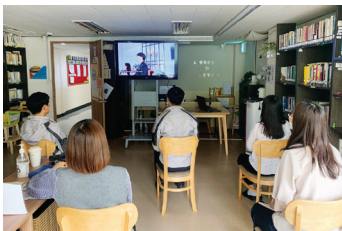
▶ 온라인 태화100주년기념예배