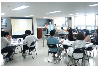
▶ 전직원 온라인 콘텐츠 워크숍1