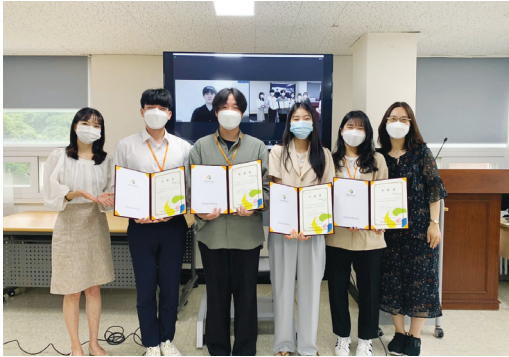
▶ 복지서비스팀 1학기중 사회복지현장실습 최종보고회