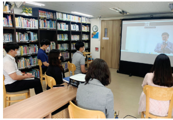
▶ 6월 온라인 직원 새힘날교육