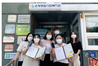
▶ 주민돌봄자립팀 하계방학 사회복지현장실습