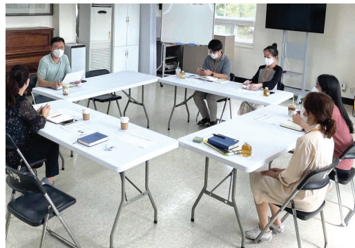
▶ 수색동밀착형 민관협력회의