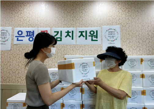
▶ e-mart 은평바 여름나기 김치지원 전달