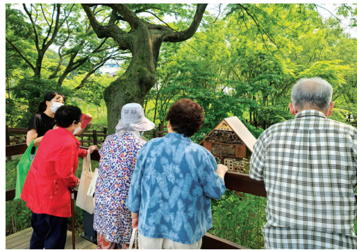
▶ 백신접종 어르신 특별 나들이