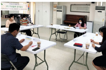
▶ 응암2동밀착형 민관협력회의