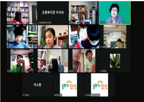
▶ 랜선 책놀이 활동 프로그램